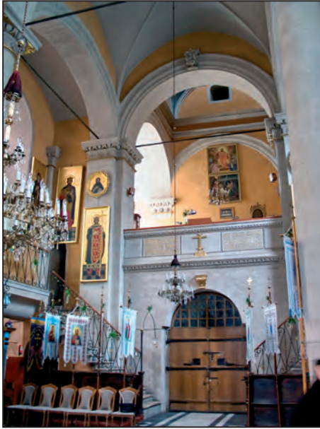
Fig. 5. Balconul bisericii (detaliu de interior)