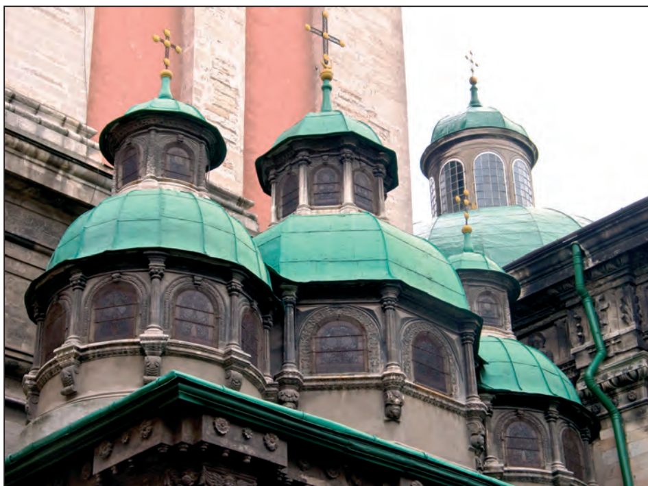
Fig. 3. Cupolele exterioare ale bisericii

felul acesta, întreținerea bisericii și a școlilor de pe lângă ea erau asigurate. Ele erau sprijinite moral și material. Aceste „Frății”, formate pe lângă bisericile parohiale, s-au dezvoltat în cursul secolelor al XVI-lea și al XVII-lea, ajungând organizații puternice, având scopuri caritabile și culturale.