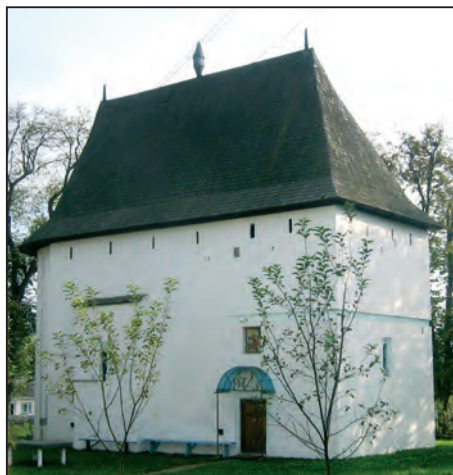
Fig. 1. Biserica din Toporăuți

Domnul Moldovei Miron Barnovschi s-a născut la Toporăuți, „după anul 1590, menționează hrisoavele. Acest sat a fost atestat documentar la 1435. Fosta moșie „cu boierești curți, nu departe de Prut, erau înconjurate de fânețe, imașuri, bogate heleștee cu pește, dumbrăvi, loc bun de vânătoare” 4 , se află astăzi, după cum am mai amintit, în regiunea Cernăuți, Ucraina. Dumitru Barnovschi, tatăl viitorului domn, a zidit pe la 1560 o bisericuță la Toporăuți, pe care au dărâmat-o turcii în drumul lor spre Hotin. Biserica, cu hramul Sf. Ilie,