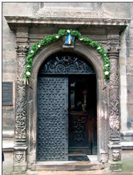
Fig. 4. Ușa de intrare din curtea bisericii

Iar deasupra corului găsim două tăblițe cu inscripția slavonă pe cea din stânga: „Ale tale dintre ale tale Împărate Hristoase, robul Tău Miron Barnovschi Voievodul Moldovlahiei, îți aduce la săvârșirea hramului acestei biserici”. Iar pe tăblița din dreapta este un verset din Sfânta Scriptură: „Primește deci cu milostiviri Iisuse, cuvântul lui Dumnezeu, cel care te-ai răstignit cu trupul și care ești vestitorul tuturor, acest sfânt hram și izbăvește pe oameni de cel viclean” (Fig. 7 și 8).