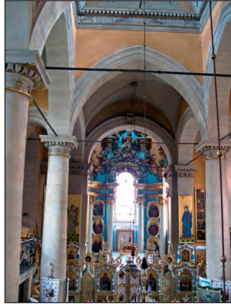
Fig. 6. Catapeteasma și altarul Bisericii Valahe