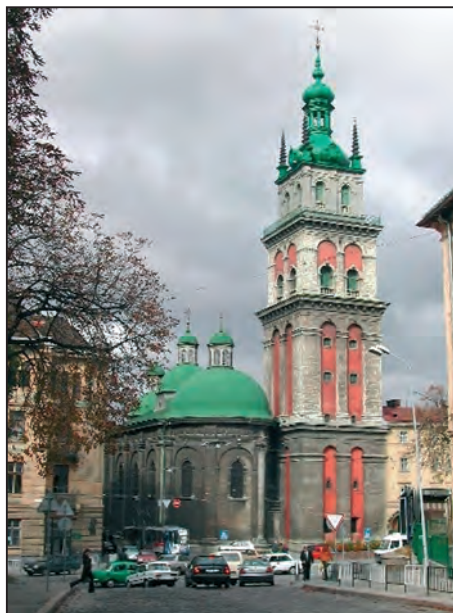
Fig. 2. Biserica Stavropighiei („Biserica Frăției”, „Biserica Valaha”) din Lviv

După cum bine se știe, după căderea Constantinopolului, domniii țărilor Moldovlahiei s-au considerat întotdeauna patroni și ocrotitori ai dreptcredincioaselor și îndatinatelor dogme ecleziastice răsăritene. Voievozii români au devenit în același timp și ocrotitori ai ortodocșilor din Polonia, Ungaria, Transilvania. Prin legăturile Moldovei cu Polonia s-a realizat un program susținut care avea ca obiect înzestrarea populației ortodoxe, foarte numeroasă, din Lemberg. Multă vreme s-a auzit aici rostindu-se via valachia ori pons valachicus . Grupuri compacte de români se găseau și în părțile Samborului, Sanocului și Przemysului. Pentru a-și apăra mai bine interesele confesionale, și în primul rând de influența catolicismului în ofensivă, credincioșii din Lemberg s-au constituit, pe la 1463, în comunitatea religioasă numită Bratstvo (Frăție), organizată după modelul breslelor de meseriași și industriași. În