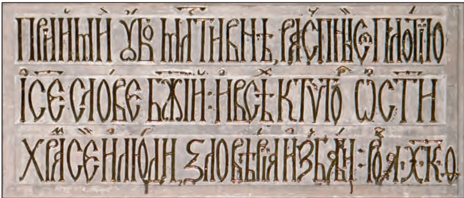
Fig. 7. Inscripție deasupra corului în slavonă (stânga)

Evenimentul cultural din 1630, care a avut loc la Lviv prin tipărirea Octoihului , finanțând totodată funcționarea tipografiei, a fost urmat la 16 ianuarie 1631 de un act artistic de o rară festivitate a ortodoxiei, căci marea construcție a Stavropighiei se sfințește, iar Miron vodă era sărbătorit ca „Săvârșitor” al acestui impozant monument arhitectonic.