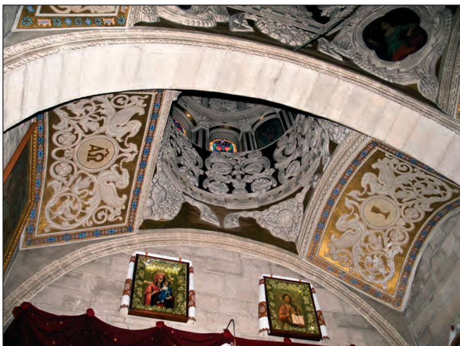
Fig. 11. Cupola centrală (detaliu de interior)

balcon sau în subsolul bisericii. Cupola centrală interioară este înaltă, puțin luminată, dar aurită în interior, culoare care-i dă un farmec aparte. Celelalte două cupole interioare mai mici sunt vopsite în culoarea cerului. Spectrul de culori alb-auriu trece brusc în candelabru masiv principal, de aceeași culori, care îți creează impresia că este un fel de continuare a cupolei.